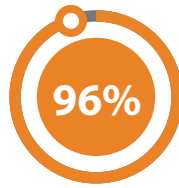
Виконання першого плану дій (2012-2013)

Понад 20 громадських організацій є партнерами Уряду у впровадженні Плану дій