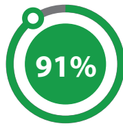
Стан виконання на 1 лютого 2017 року другого плану дій (2014-2015)